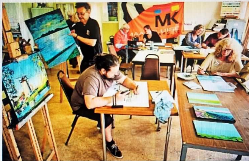
▲ De kunstenaars werken hard aan hun creaties geïnspireerd op de viering van 150 jaar Waterweg.